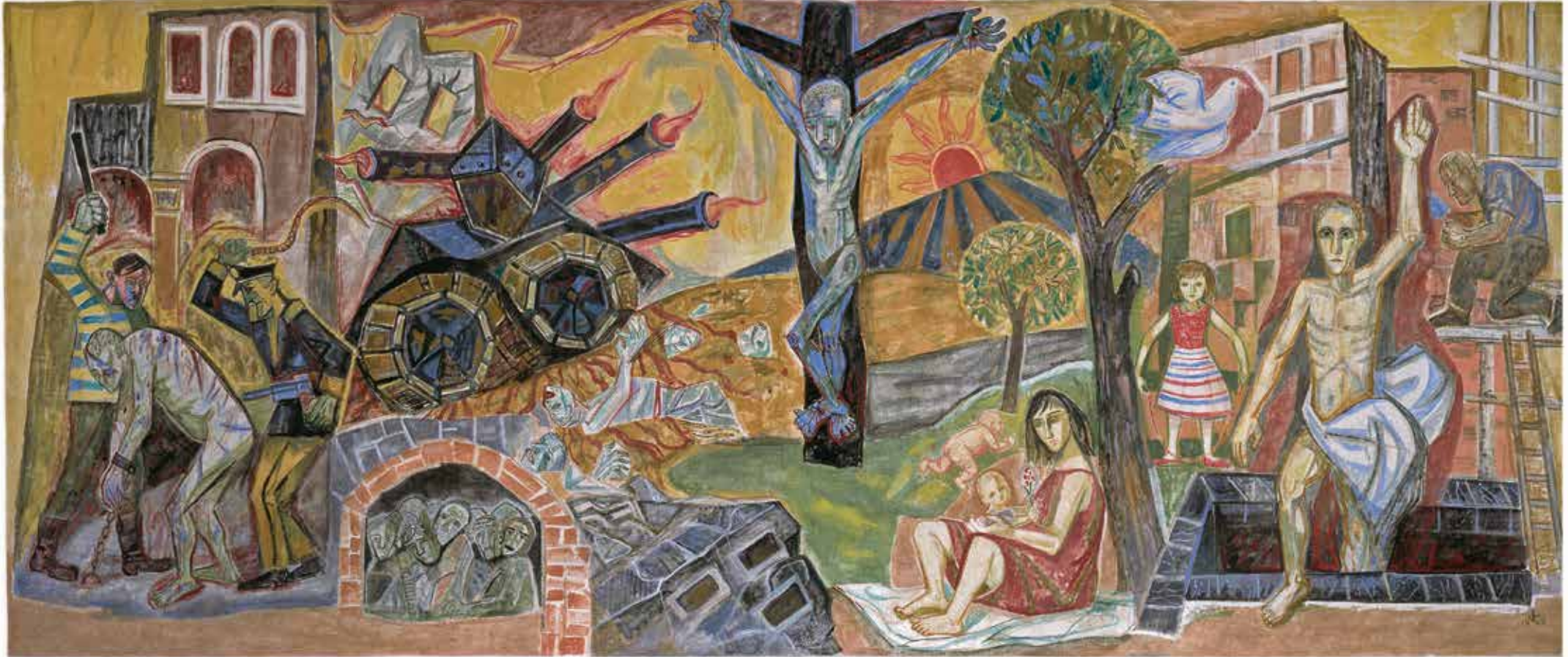
Otto Dix, Krieg und Frieden, 1960 Keimsche Mineralfarben Technik A (nach Kurt Wehlte) auf Silikatputz Rathaus Singen (Hohentwiel), Ratssaal

Das einzig erhaltene, monumentale Wandbild von Otto Dix findet sich in Singen am Hohentwiel.